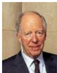
Otac Jacob Rothschild