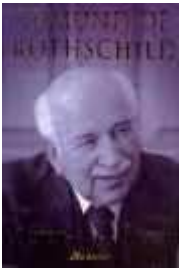
Edmund Rothschild (1916)

Karijeru je gradio forsiranjem britansko-hazarskih interesa u poslijeratnom Japanu. U saradnji sa Winstonom Churchillom je osnovao BRINKO (British Newfoundland Development Corporation) korporaciju u Kanadi.