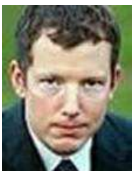
Nathan Filip Rothschild (1971)